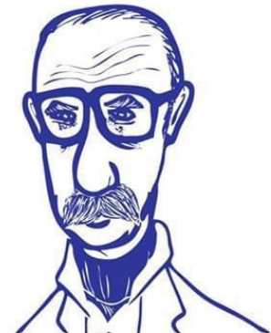
ALGIRDAS JULIEN GREIMAS (Tula, 1917-1992)