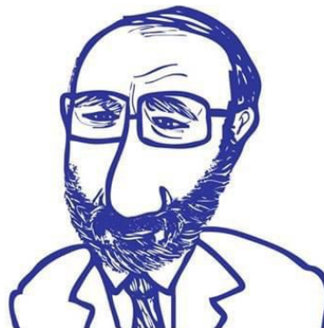
UMBERTO ECO (Alessandria, n. 1932)