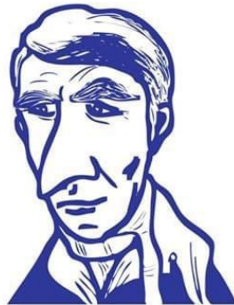
ROLAND BARTHES (Cherbourg, 1915-1980)